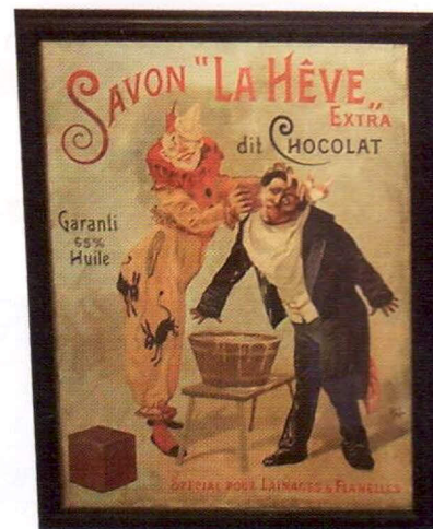
Quand le célèbre clown Footit lavait plus blanc son compère Chocolat avec le savon La Hève, une des premières affiches, datée de 1895.

magasin et son diaporama sur la saponification artisanale (16 000 visiteurs l'an dernier), on pourra, muni d'un jeton payant, plonger librement dans l'épopée publicitaire de cette "denrée" aussi précieuse que la nourriture pendant la Seconde Guerre mondiale (on y trouve un grand panneau explicatif, photographies à l'appui, sur ce sujet). On peut aussi préférer la visite guidée. Car les anec-