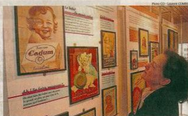
Cette année, la Savonnerie Martin de Candre s'est enrichie d'un musée unique en Europe, dédié à la publicité sur le savon des années 1860 à 1960.