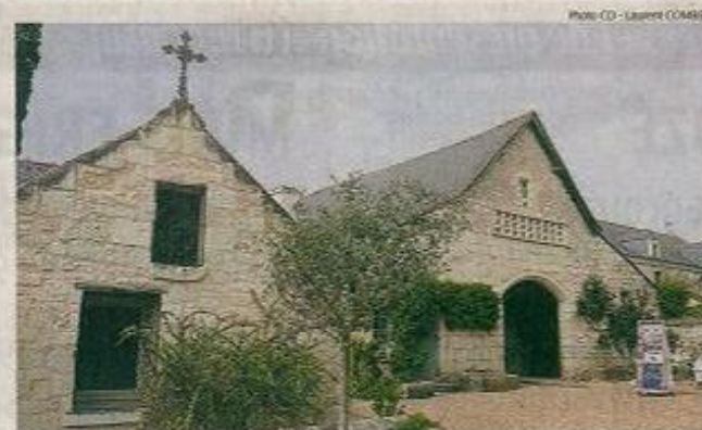
C'est dans une magnifique grange du XII e siècle, dans la cour attenante à la savonnerie, qu'a été installé le nouveau musée « Quand le savon fait sa pub ».