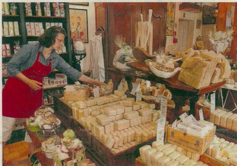
Fontevraud, Savonnerie Martin de Candre, début mai. Sous l'atelier de fabrication artisanale, la boutique-exposition, d'où s'échappe, tout au long de l'année, un parfum doux et subtil.

« Ma mère a repris le savoir-faire et les recettes données par un savonnier de Vierzon qui n'avait pas de successeur et qui s'en désolait », raconte Hélène. Aujourd'hui, c'est elle qui, quatre fois par semaine, mélange soude et huiles végétales, pour fabriquer, à l'ancienne, les pains de savon. A ses côtés, sept salariés reproduisent les gestes ancestraux de séchage, de pressage et d'emballage avec, pour certaines tâches, l'aide de la technicité contemporaine. Pour des questions d'hygiène et de sécurité, l'atelier est désormais fermé à la visite, mais un diaporama, volontiers